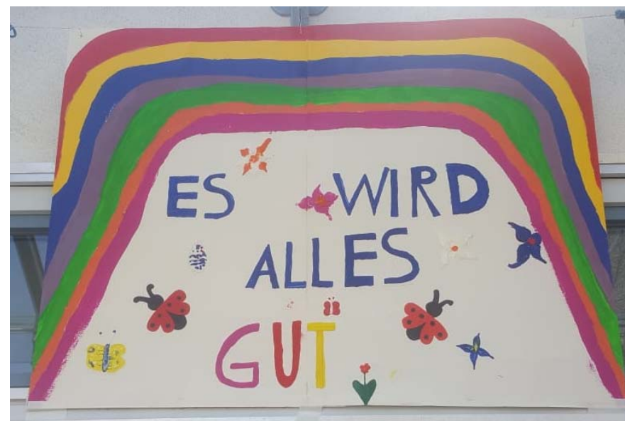
Neuster Schmuck des SZ Rohrbach

Die Mitarbeiterinnen der drei Seniorenzentren des Diakonischen Werks der Evangelischen Kirche Heidelberg wünschen Ihnen –trotz der erschwerten Umstände– Frohe Ostern!