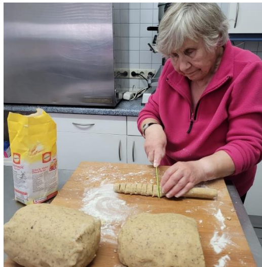
(Impressionen vom Back-Nachmittag)