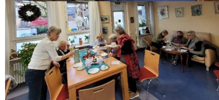
(Impressionen vom 1. Advent)