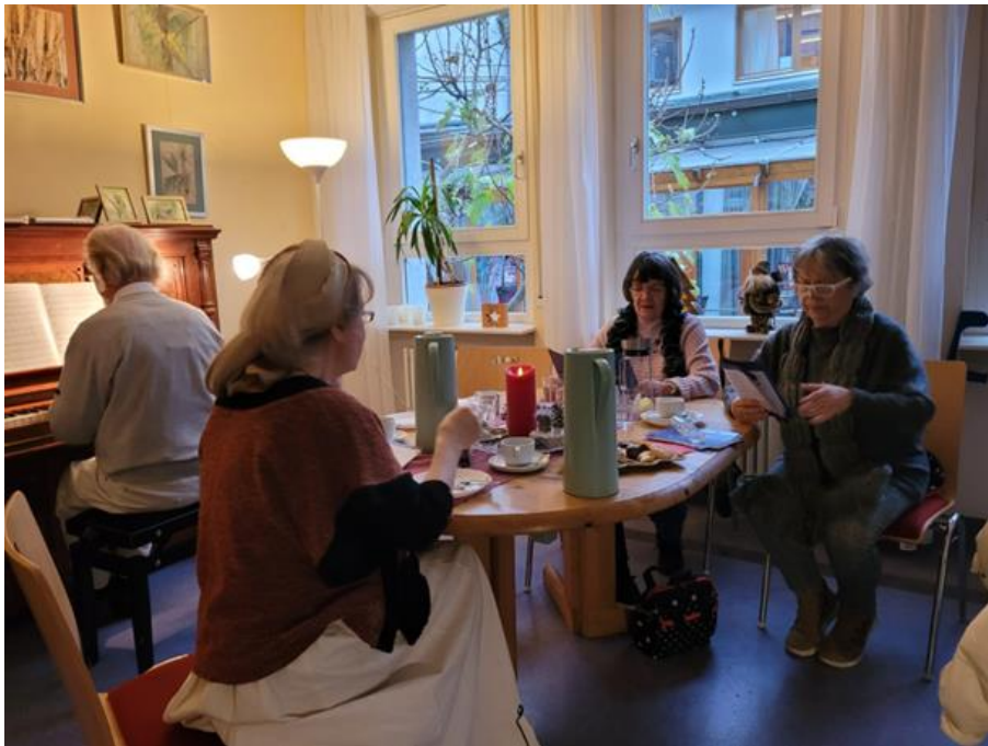
(Impressionen vom 2. Advent, Fotos: SZ Bergheim)

Bei Kaffee und Kuchen, Kerzenlicht und Klavierklängen nahm Frau Planeth alle Anwesenden mit auf eine Reise und bescherte allen einen zauberhaften Nachmittag, der auf Weihnachten einstimmte und auch zum Singen und Austauschen animierte.