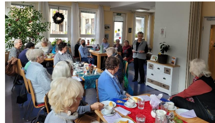
(Impressionen vom 1. Advent)

Unsere Gesangs-Gruppe begleitete die Ausstellung und motivierte alle Anwesenden mitzusingen. Selbstgebackene Weihnachtsplätzchen, leckerer Kuchen sowie stimmungsvolle Dekoration und Weihnachtsklänge animierten zum gemütlichen Beisamensein, anregenden Gesprächen und zogen etwa 40 Besucher*inenn an. Im folgenden erhalten Sie anhand der Fotos einen kleinen Eindruck über den gelungenen und fröhlichen 1. Advent: