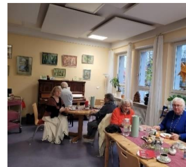
(Impressionen vom 2. Advent)