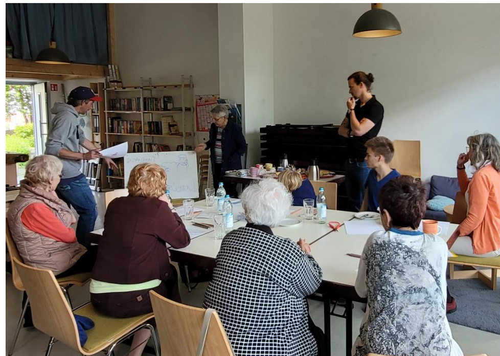
Fotos: Impressionen des Graffiti-Workshop

Das Projekt-Team bedankt sich herzlich für die engagierte Mitwirkung der Teilnehmenden & bei allen Kooperationspartnern für die tatkräftige Unterstützung.