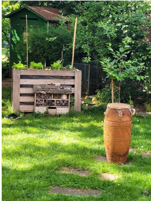
Foto: Impressionen vom Capoeira Workshop am 13.05. im Garten des SeniorenZentrums Bergheim

Nach einem Schnupperangebot startete im Mai unter Anleitung von Frau Sabine Koch der Capoeira-Workshop mit 5 Terminen, von denen zwei im Juni noch stattfinden werden.