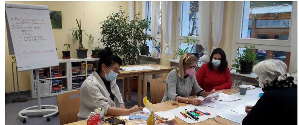
Konzeptionstag im SeniorenZentrum Bergheim am 7. Januar 2022

SeniorenZentrum Bergheim Begegnung im Stadtteil