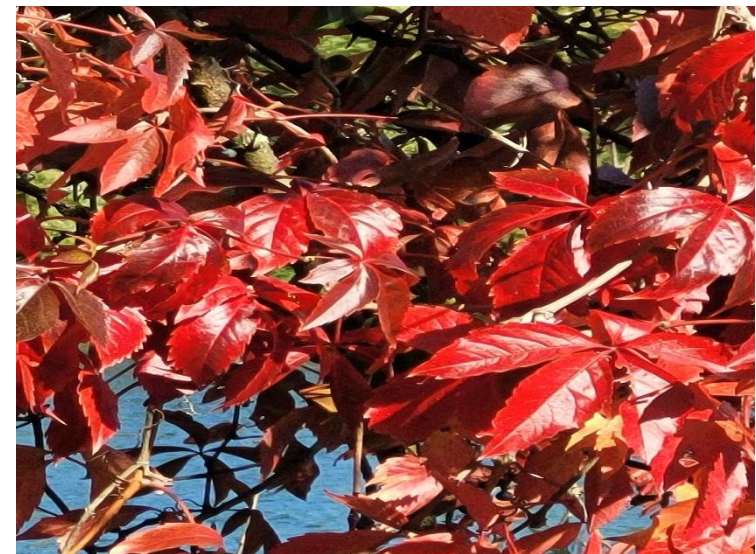
Goldener Oktober in Heidelberg